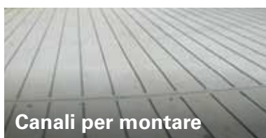
Canali per montare

Vuoi muovere i blocchi? E' facile; nonostante cio', se hai bisogno di noi, siamo sempre disponibili per il design o un setup (con i nostri anni di esperienza nel 'flow modelling').