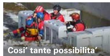
Così tante possibilità'