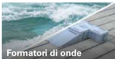
Formatori di onde

Modifica caratteristiche + treni di onde.